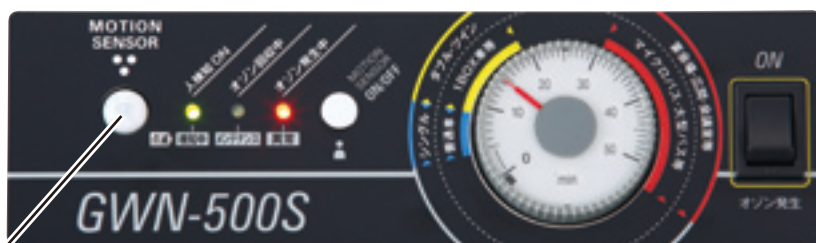
モーションセンサー

多数のユーザー様にご使用いただいている客室、車両での使用をよりわかりやすくしました。女性スタッフでも簡単に操作可能です。